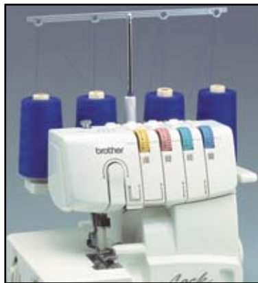
Простая система заправки нитей