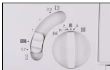
Регулировка ширины шва