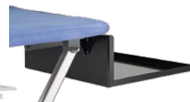
Abbassamento poggiaferro Lower iron rest